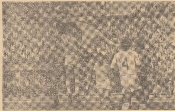
Disputa pentru balon, în meciul Progresul-Vulcan — Autobuzul

...ie, duminică... il Republicii... duit un mic... iei B, cupla-... estene”, care... I-a din eșă-... 0 de supor-... upă caz, nu... ente odată... voritelor, au... O notă în... însemnat și... n cele patru... alui, Progre-... ărturist sau... novărea în... itat antrene-... e) Drăgușin... teea meciu-... ce ne-a de-