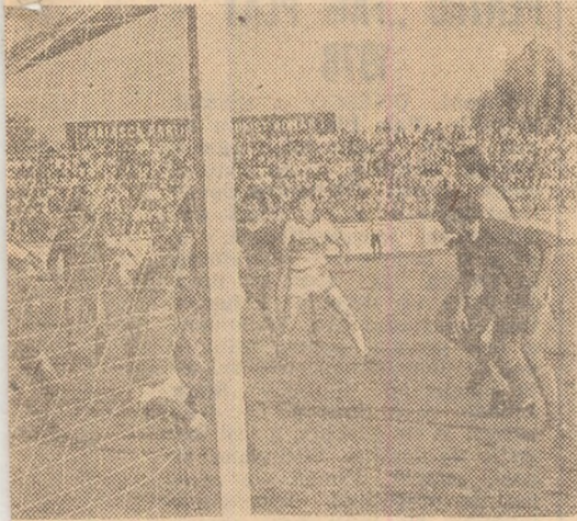
A mai puțin evita golul de data aceasta. Loviță (nascut de bară), mingea va intra în plasă.