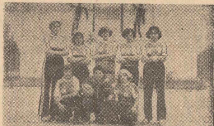
Bineînțeles, „fetele din Filipești”

— O echipă de handbal formată numai din muncitoare —