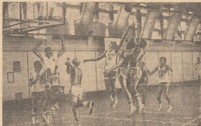
În sala Dinamo , dispută pentru minge, la antrenament — ca la meci

au abordat pregătirile cu deplină seriozitate, cu ambiția de a obține rezultate cât mai bune la București , dar și în deplasare.