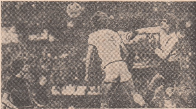
Final dramatic pe „Stadio Comunale” din Torino. Gazdele câștigă cu 2-1, după prelungiri, dar Stuttgart se califică, grație golului marcat în deplasare. În imagine, un atac al oaspeților la poarta torinezilor.

Asta însă nu înseamnă că nu au existat și surprize, ca de pildă faptul că toate reprezentantele a două țări calificate la ultima ediție a turneului final al C.M., Polonia și Austria, au fost eliminate. Și în acest context, să remarcăm că singurele țări care