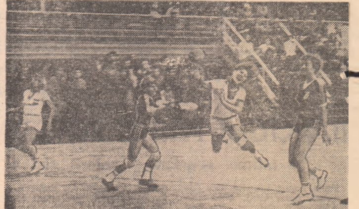
Maria Bidiac (Confecția) a găsit — în sfîrșit — o breșă în apărarea băcăuană...

RULMENTUL BRAȘOV — UNIVERSITATEA TIMIȘOARA 12—10 (6—5). Meci de mare luptă, în care victoria a revenit echipei mai bine pregătite fizic. Au înscris: Drăgușel 4, Marcov 3, Pătruș 3, Oancea 2 — Rulmentul, Cojocaru 3, Ștefanovici 3, Dicu 2, Luțaș, Hris-