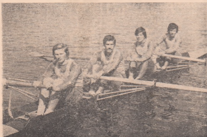
Echipajul României de 4 rame, victorios ieri, pe lacul Snagov, în întrecerile Balcianiadei de canotaj