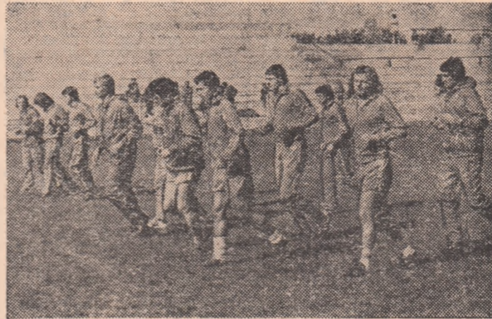
Tricolorii — într-o secvență a antrenamentului de ieri dimineață

În vederea jocului de pe stadionul Lujniki