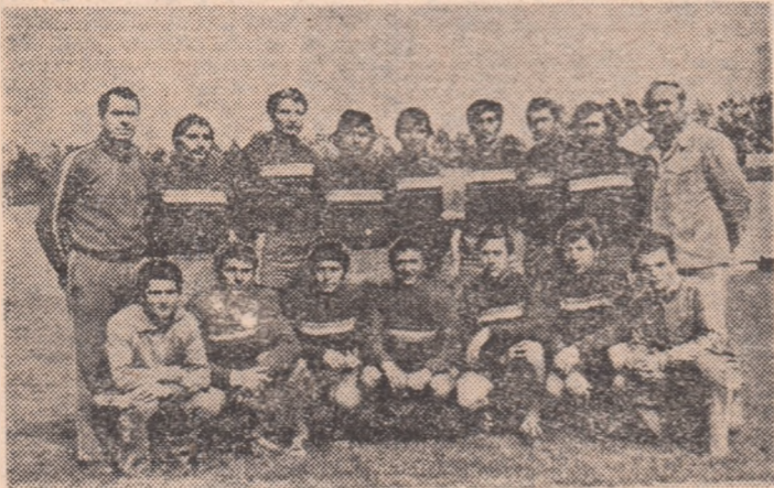
Oiniștii dinamoviști la cîteva minute după ce au îmbrăcat tricourile de campioni.