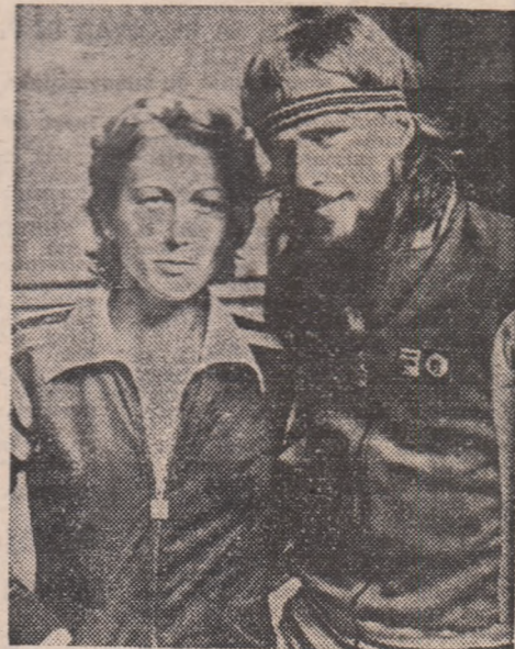
Björn Borg și Mariana Simionescu, după antrenamentul de ieri, la „23 August“

vorabil pentru ei, cînd „vechea gardă“ bate în retragere. Dacă mă consider și eu în rîndul acesteia, deși am doar 23 de ani, atunci îmi revine mie sarcina de a-i purta stindardul într-o grea luptă.