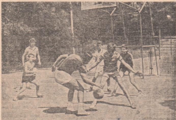
Baza sportivă a pionierilor și școlărilor „Cireșarii“ este întotdeauna o gazdă ospitalieră pentru pasionații sportului