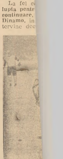
Moment din Neteđu (Stea tre care Cost

S-a încercat campionatul de hochei pe gheață (pentru alcătuirea cu un total de bilanț care prea mult cuți, semntru de performanță), dar la acest olimpic... La fel ca lupta pentru continuare, Dinamo, în terține dec