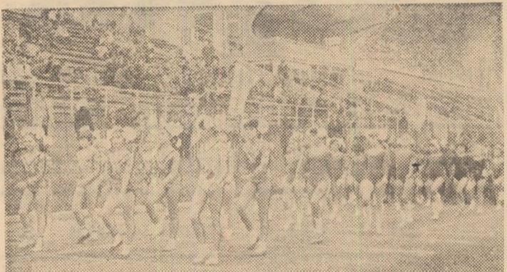
„Moțatele” din secția de gimnastică ritmică a C.S. Școlar în fruntea coloanei școlarelor-sportivi bistritei.

În cadrul manifestărilor sportive, care au loc în aceste zile pe tot cuprinsul țării, în cinstea marelui eveniment politic din viața poporului român. Congresul al XII-lea al P.C.R. deschiderea anului sportiv școlar în județul Bistrița-Năsăud a avut o notă aparte. Și vremea a ținut, parcă, să creeze un cadru cit mai propice unei adevărate erupții de viață, oferind una dintre acele după-amieze însoțite de toamnă. Peste 2000 de elevi din școlile și cluburile sportive școlare din Bistrița au fost prezenți la „Festivalul sportului școlar bistritean”, ale cărui activități centrale s-au organizat pe stadionul Gloria.