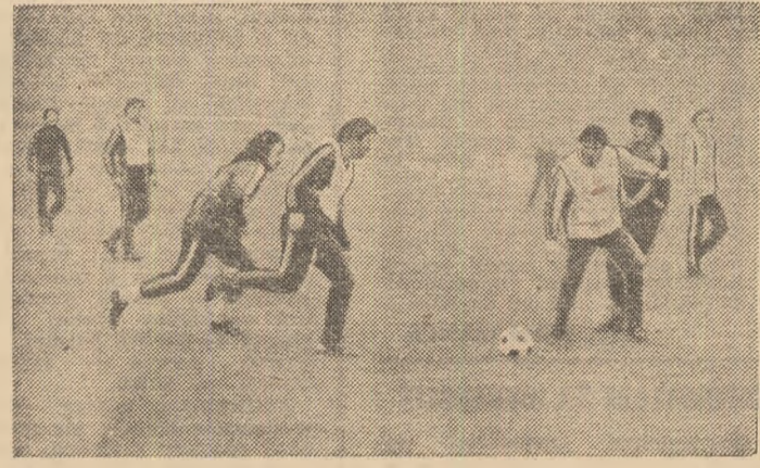
Moment de la antrenamentul de ieri dimineață al echipei F. C. Nantes