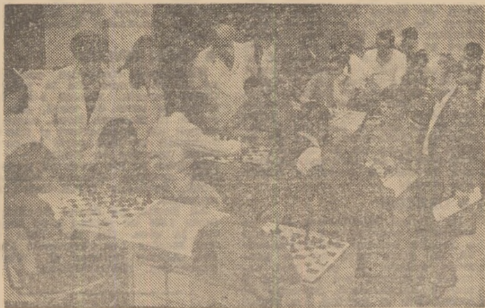
Aspect de la concursul de șah organizat la întreprinderea de mecanică lină.