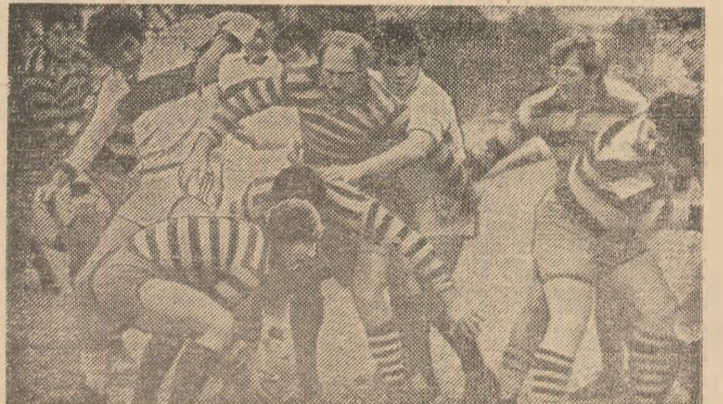
În performanța băimăreană, rugbyul se impune tot mai mult, prin prestări remarcabile și chiar prin rezultatele deosebite ale echipei Știința CEMIN (tricouri în dungii).

velul unităților de bază, o selecție riguroasă („nu se urmărește numai creșterea numărului practicanților sportului de performanță, ci, în principal, detașarea valorilor autentice, cu reale perspective pe plan național“). Firește, selecția reprezintă un proces extrem de complex. În școlile băimărene el se realizează aducînd în sprijinul reușitei toți factorii educaționali, familia, profesorii, organizațiile de pionieri și tineret. În cazul natației, selecția se realizează încă din grădinițe, de personalul acestor instituții. La fiecare început de an școlar, prin sîta selecției trec mii și mii de copii. Cei mai buni, cei mai înzestrați sînt îndrumați către secțiile cluburilor. Acolo, perio-