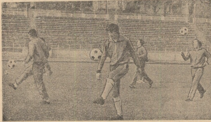
Un moment din antrenamentul de ieri dimineață al tricolorilor, desfășurat pe stadionul Dinamo