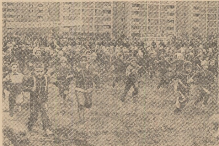
Copiii noștri, sute de copii, la unul din starturile „Dacia”

„Dacia” să treacă — într-un proces firesc și o evoluție logică, ascendentă — spre o nouă calitate. O trecere care trebuie neapărat să aibă la bază continuitatea de acțiune (nu două crosuri pe an! — cum se mai întâmplă uneori), o trecere în care sensurile „Dacia” să devină convingerea tuturor. „Dacia” nu este o simplă