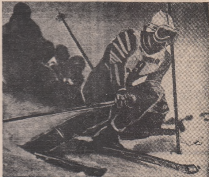
Ingemar Stenmark, din nou prim candidat la „Cupa Mondială”

Competiția internațională de sărituri cu schiurile desfășurată pe trambulina de la Villach (Austria) a fost câștigată de Alfred Groyer (Austria) cu 241,8 puncte (săriturile sale au măsurat 83 și respectiv 70 m). Pe locul doi s-a clasat cocchișterul său Hubert Neuper cu 231,77 puncte, învingător acum citeva zile în tradiționala competiție „Trofeul celor 4 trambuline”.