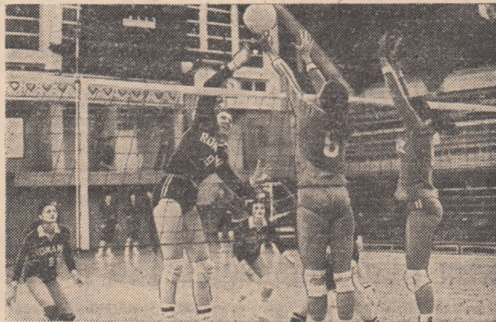
Secvență din jocul de antrenament susținut ieri de voleibalistele române și braziliene.