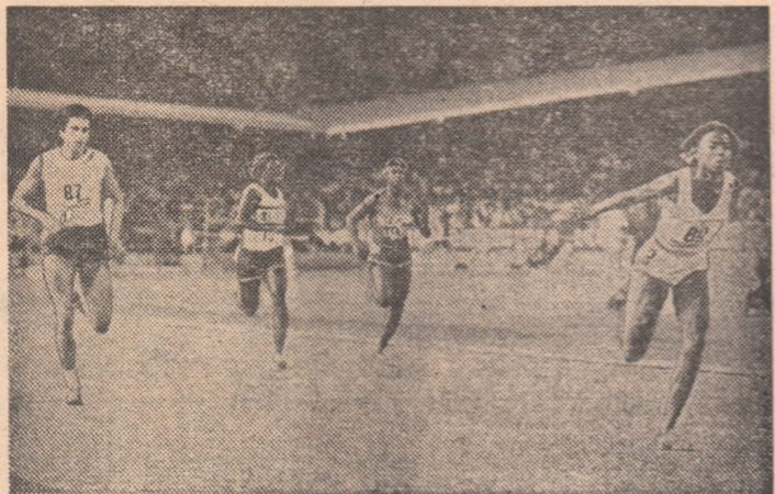
Evelyn Ashford (prima din dreapta) câștigînd proba de 100 m în concursul de la Zürich

Evelyn Ashford nu a stabilit nici un record mondial în 1979. Prezența sa în rîndul celor mai bune sportive ale anului se datorează, lucru destul de rar în tîlnit în atletism, mai ales într-un sezon preolimpic, în primul rînd unor victorii și nu unor performanțe cifrice. Este adevărat, cele două victorii, obținute în același concurs, la „Cupa Mondială” de la Montreal , au avut un răsunet aparte, pentru că învinșele sprinterilor de culoare nu erau altceva decît cele mai valoroase alergătoare de viteză ale atletismului mondial. În ultimii 2-3 ani, Marlies Göhr și Marita Koch , recordmane mondiale la 100 și 200 m. La 21 august, pentru a-1 aduce Marita Koch singura înfrîngere pe distanța de 200 m în ultimii doi ani, Ashford a alergat 21,83 (Koch 22,02, a doua performanță a sa) adică cu 41 de sutimi sub precedentul său record personal — pe care îl mai îmbunătățise de două ori în vara trecută, coborîndu-1 de la 22,62 — devenind a doua alergătoare din istoria probei care coboară sub bariera de 22 secunde (Koch, 21,71, făcuse premiera în Jocuri ). A doua zi, 25 august, Ashford o întrece la fel de clar pe Göhr la 100 m (11,06 — 11,17), confirmînd acel 10,91 cu care fusese creditată la începutul sezonului, la Walnut , al doilea rezultat din toate timpurile, după recordul lui Göhr (10,89).