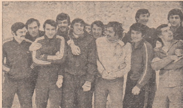
Handbaliștii prind puteri noi la Herculan...