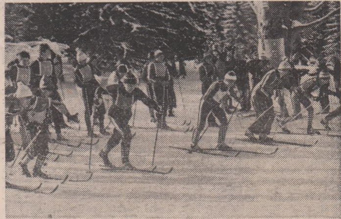
Start în proba de schi fond