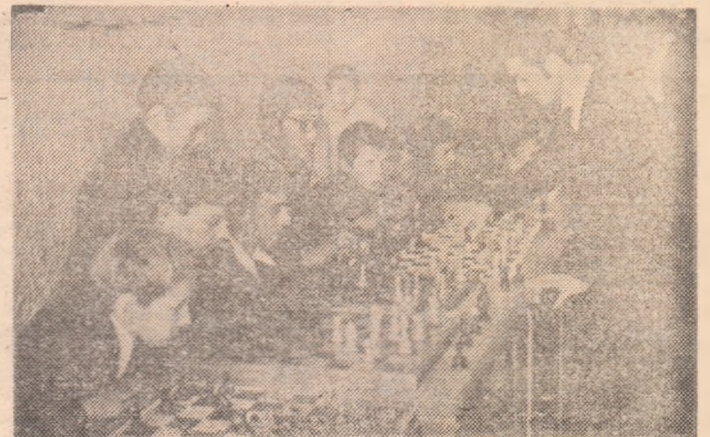
O „scență” din simultanul de șah care a avut loc la Liceul industrial „Grivița Roșie”. Copiii față în față cu șahistul Ilie Petrăchioiu, de la asociația „Locomotiva”

ta-o și acum, în concurs, dar și altă dată, ca neobosit propagandist al popicelor, el fiind