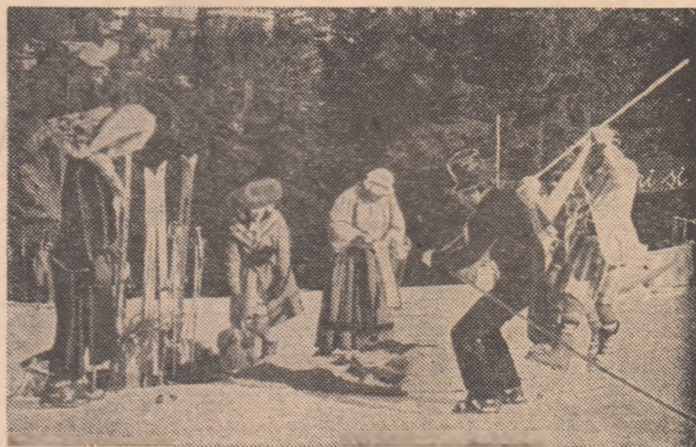
Cit ai bate din palme, cortul va fi instalat...