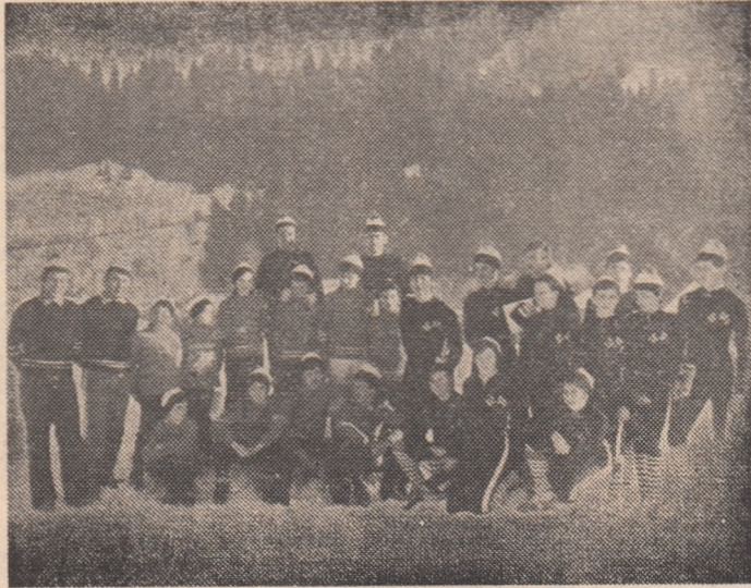
Grupa schiorilor alpini din Cîmpeni

Referindu-mă la condițiile naturale, subliniam faptul că răzlețirea a sute de case la 5-7-10 kilometri de așezările urbane și rurale „naște” de la sine tineri schiori. Începînd din prima clasă, de la vîrstă de 6-7 ani, băieții și fetele de moți iau ghiocdanele în spate, se urcă pe schiuri și pornesc spre școală. O oră, uneori și mai mult la dus, același timp la întors, iată două excelente antrenamente zilnice, antrenamente fără nici un antrenor, făcute și de voie și de nevoie. Tot la condiții, aminteam și sprijinul cu totul deosebit acordat de C.C. al U.T.C., care în trei tabere de schi organizate la Cîmpeni i-a dotat pe tinerii sportivi localnici cu materiale în valoare de 600 000 lei, asta însemnînd sute de perechi de schiuri, sute de perechi de clăpări, săniuțe etc. Ajutor ma-