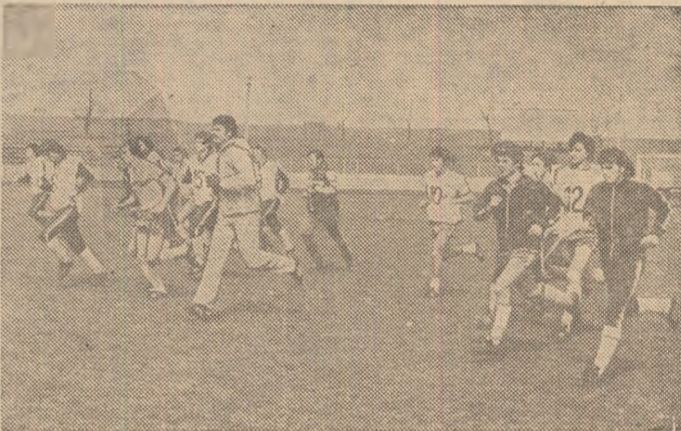
Tricolorii, în timpul antrenamentului efectuat, ieri, pe stadionul Metalul