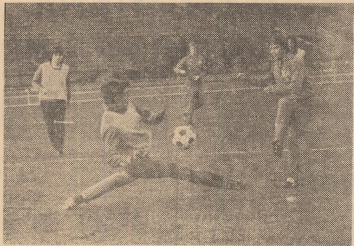
Șutul la poartă, un capitol important, ieri, în antrenamentul oaspeților.