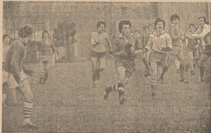
Fază din primul antrenament-școală al componentilor lotului reprezentativ (pentru meciul cu XV-le Marocului) susținut în compania Farului Constanța. În imagine: Bucos (cu balonul), inițind un nou atac al selecționabililor