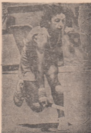
Virginia Ruzici, în timpul partidului de ieri cu Dianne Fromholtz.