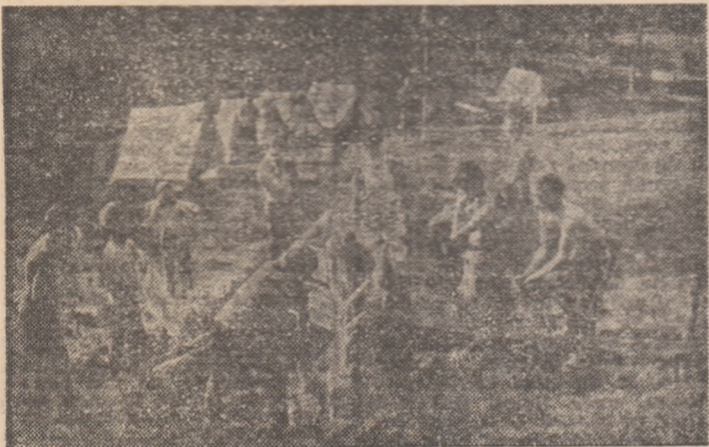
Copiii îndrăgesc tot mai mult turismul de masă, care le oferă prilejul de a cunoaște frumusețile țării și de a-și petrece zilele de vacanță într-un mod plăcut și instructiv, în aer liber. Iată-i pe pionierii de la Școala generală nr. 1 din Petrița, într-una din numeroasele lor expediții.

După campionatele internaționale și „Cupa țărilor latine“ la pentatlon modern