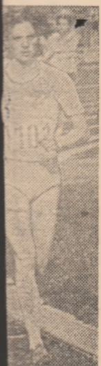
ri de Mari- startul pen- la J.O