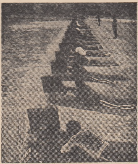
Aspect din timpul concursului.

Marea Neagră, 2. Dinamo Băneasa I, 3. Dinamo Prahova. Mirceo COSTEA