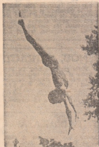
Luiza Nicolaescu, pentru prima dată campioană națională