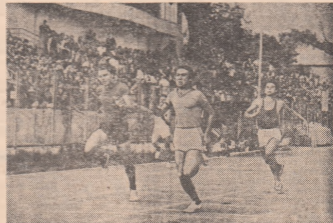
La jumătatea cursei de 100 metri plat, la cota efortului maxim...

care din atitea să le consemneze? Pe cele legate de eforturile cu totul și cu totul remarcabile ale organizatorilor de a crea acestor competiții școlare un cadru nu numai sărbătoresc (o minunată festivitate de deschidere), ci și cu puternic ecou propagandistic, precum și condiții ireproșabile de sejur „în dulcele țirg” și de concurs participanților? Pe cele referitoare la cifre care, fără a li se adăuga alte detalii, spun mult: 900 de concurenți din toate județele țării; tribunele stadionului pline cu elevi ieșeni însoțiți de cadre didactice, cu alți iubitori ai sportului, mai ceva ca la un important meci de fotbal al lui „Poli” (și această senzație era întărită de permanența pe tabela de scor a ultimului rezultat obținut de studenți în recentul încheiat campionat); recorduri ale competiției — dotată, firește, cu „Cupa U.T.C.” — la toate sta-