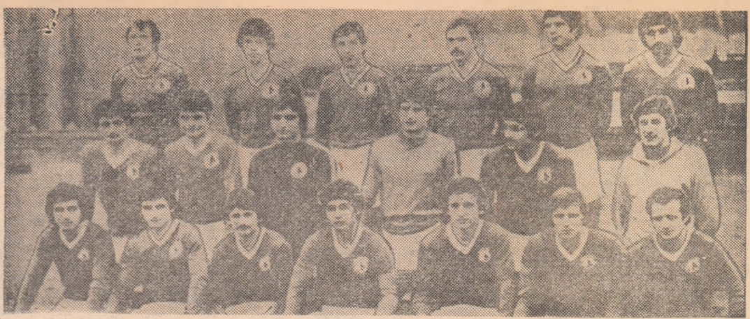
Lotul hunedorean, cu cele două generații „topite” în echipa care a reușit o frumoasă revenire în „A”.