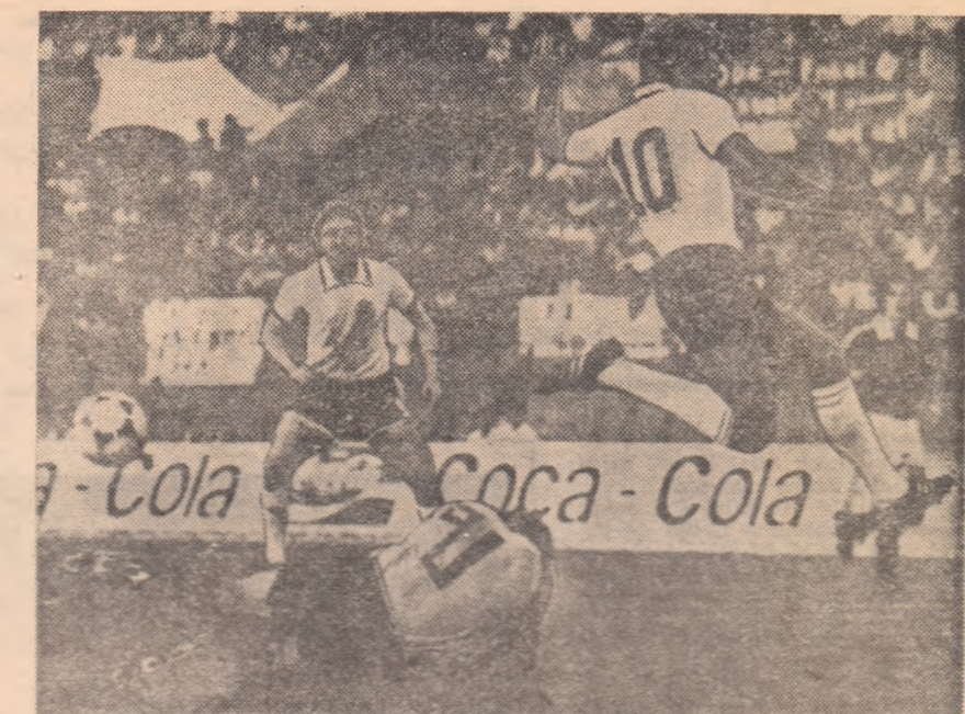
Hansi Müller, câștigătorul premiului Bravo '80, unul dintre cei mai buni jucători ai R.F.G., recent campioană continentală, într-o caracteristică atitudine la finalizarea unei acțiuni de atac

La o selecție care și-ar propune să scoată în evidență jocurile sau părțile de joc cele mai spectaculoase, mai atractive,