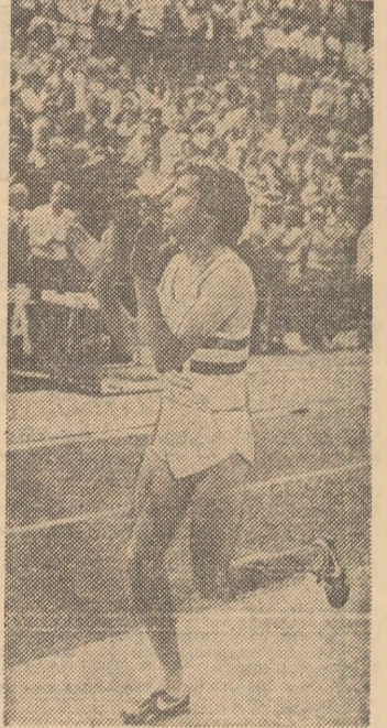
Sebastian Coe în formă: 2:13,4 la 1000 m! Steve Ovett răspunde cu 3:48,8 pe o milă...

tr-adevăr, ceva senzațional, dar planurile îl pot fi compromise de un accident recent care i-a întrerupt antrenamentele chiar atunci cînd Viren începuse să-și pregătească furibundul finis... Numărul mare de victorii în curse importante atrage atenția asupra etiopianului Miruts Yifter (peste 35 de ani), pe care presa mondială îl consideră mare favorit. Yifter a și decla-