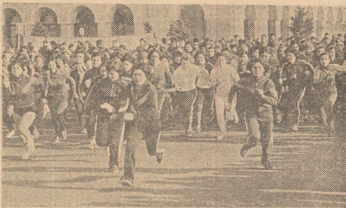
La acțiunile sportive de masă din cadrul competiției naționale „Daciada” au luat parte peste trei milioane de femei. Iată un aspect surprins la o asemenea acțiune.

În viața economică, politică, și socială a țării noastre femeile și-au adus totdeauna o contribuție de seamă, afirmându-se plin prin putere de