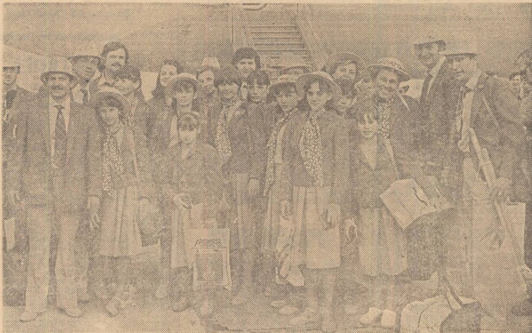
Gimnastele, lîngă scara avionului care le-a adus de la Moscova.