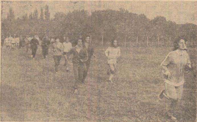
Acțiune de succes în județul Dolj: cros în mijlocul naturii

făcut. A fost, de fapt, o reușită ședință de lucru, cu referate și luări de cuvânt interesante, cu lecții practice. S-au arătat — în referatul prezentat de către Comisia de specialitate a C.N.E.F.S. — rezultatele bune obținute în marea competiție națională „Daciada”, apariția unor competiții