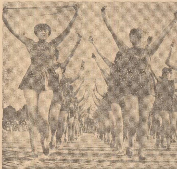
Una din realizările de seamă ale acestor ani este dezvoltarea sportului feminin. La startul întrecerilor „Daciaei”, la competițiile și festivalurile sportului feminin se aliniază mii și mii de participante.