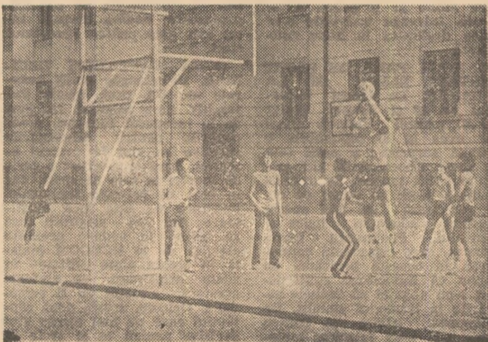
După ce au lucrat cu spor la amenajarea terenurilor, o repriză de baschet este bine venită pentru elevii de la Liceul de informatică.