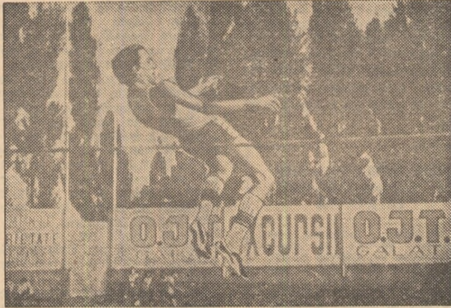
...săritură reușită la 2,27 m