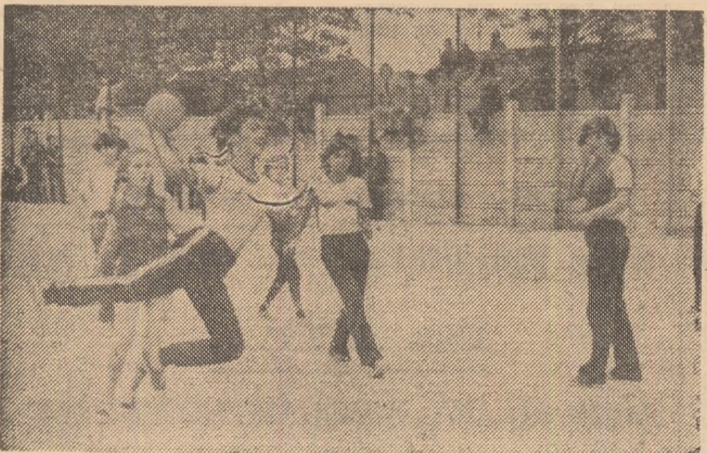
Și la handbal, întreceri disputate în cadrul „Festivalului sportiv al fetelor dimbovițene“: fază din meciul Voința Tirgoviște — Liceul de chimie Găești

instructori de specialitate. Obişnuință, deci, cu exercițiu fizic, cu sportul, cu întrecerile de la sfîrșitul săptămîinii. De aici și succesul înregistrat, duminică, cu prilejul „Festivalului sportiv al fetelor dimbovițene“, manifestare sărbătorească organizată de comisia amintită, de C.J.E.F.S. Dimbovița, de ceilalți factori cu atribuții în sport și găzduită cu dragoste de locuitorii orașului Titu.