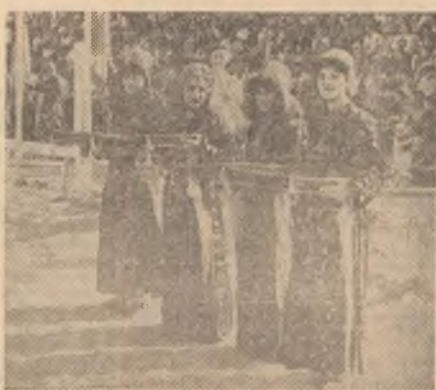
Fete, în frumoase costume populare, au dat farmec și culoare festivităților de primărie ale Campionatelor balcanice de călărie, de la Ankara.

...Campionatele sînt în plină desfășurare. Din