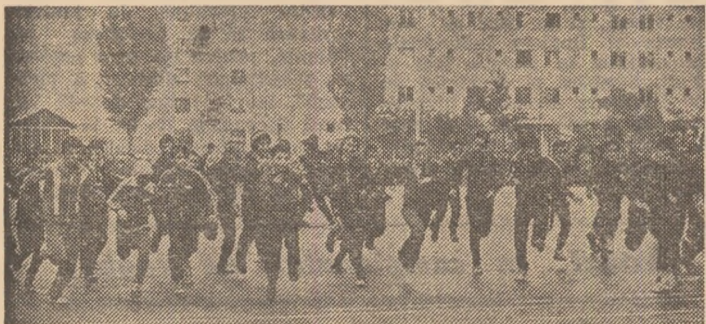
O tură în jurul terenurilor de sport, apoi crosiștii de la „22” vor evolua... în livada cu nuci a școlii.