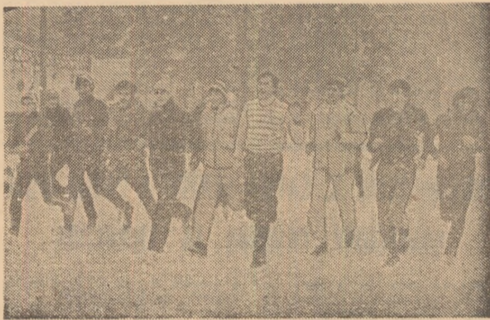
Primii fulgi de nea pe stadionul Tineretului, primele alergări în cadrul noii etape a „Daciadei”

În Capitală, momentul festiv al deschiderii celei de-a II-a ediții a „Daciadei” a avut ca principal loc de desfășurare sala Floreasca. Într-o ambianță tinerească, specifică, de altfel, tuturor marilor acțiuni sportive de masă și de performanță, sute de tineri au luat parte la o serie de spectaculoase întreceri și demonstrații. Astfel, spectatori care au populat tribunele au fost martorii unei