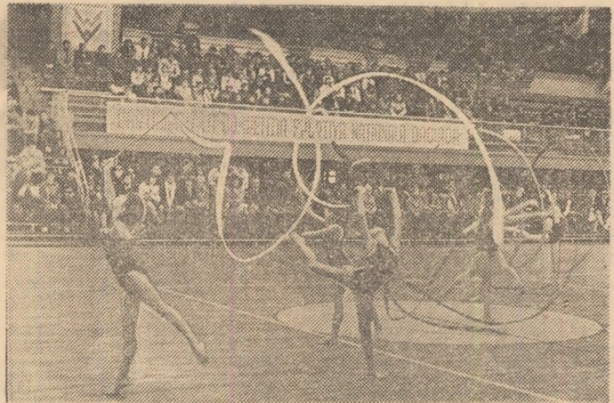
In Capitală, deschiderea noului edificiu a „Daciadei“ a fost marcată de un frumos program competițional, cu numeroase și aplaudate demonstrații ale sportivilor frunțași. o repriză de gimnastică susținută, în sala Floreasca, de elevii bucureșteni