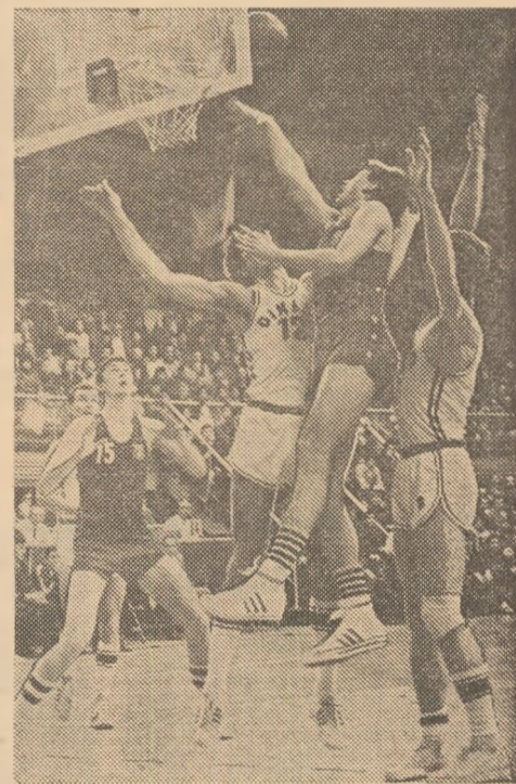
Luptă pasionantă și spectaculoasă pentru balon, fază desîntîlnită în meciurile Dinamo — Steaua.

la Steaua). Sperăm ca întrecerea să ofere un spectacol sportiv atrăgător, în care combativitatea și disciplina jucătorilor să primeze. Meciuri de atrac-