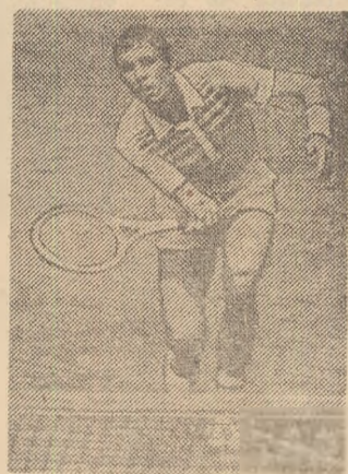
Ivan Lendl, la București

clasamentul tradițional al Marului premiu F.I.L.T. el ajunge pe locul 2, devansat de McEnroe, dar precedînd pe Borg și Connors! Pentru el, 1980 a