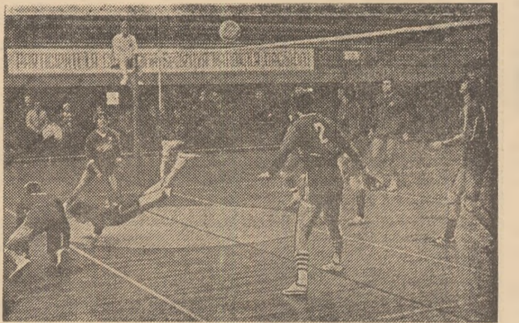
Atacul echipei Steaua a provocat derută în formația băcăuană

STEAUA — VICTORUL BACĂU 3-0 (7, 8, 8). Victoria