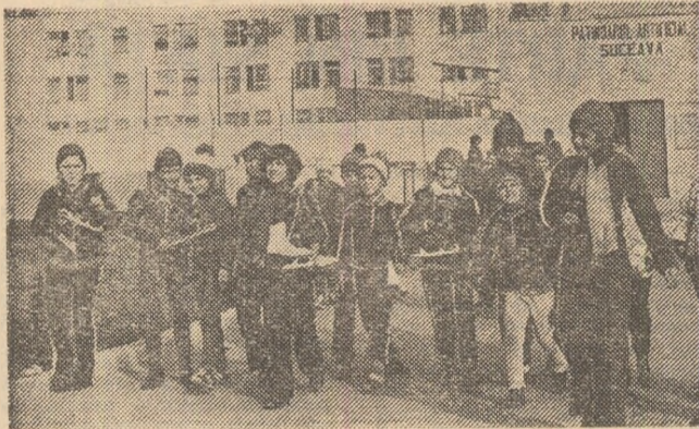
Pe patinoarul artificial de la Suceava (loc unde țarna a venit mai devreme), numeroase fete și băieți vin zilnic, după cum se poate vedea din imaginea surprinsă de foto-reporterul nostru N. Dragoș, dornici să deprindă tainele acestui frumos sport.