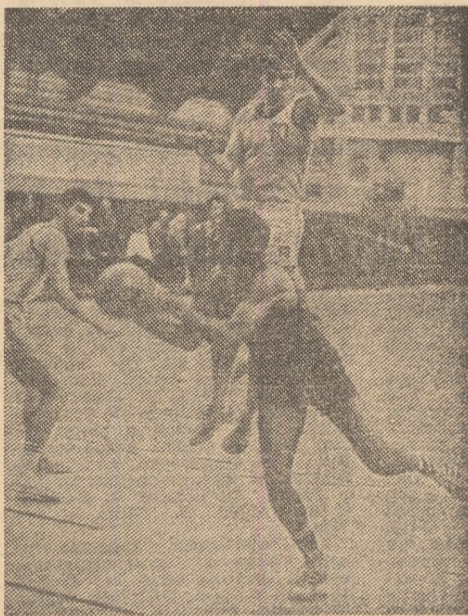
Bradu (Rapid) și-a păcălit adversarii și va arunca la coș. Fază din meciul Rapid - C.S.U. Brașov.

Campionatul național de baschet masculin a continuat ieri, în Capitală și la Iași, cu meciurile etapei a doua a celui de al treilea tur al competiției. Rezultate :