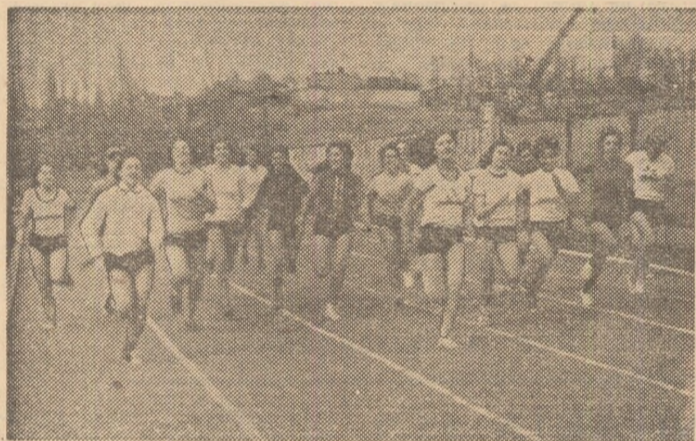
Crosurile constituie una din activitățile sportive preferate pentru fetele de la „Flacăra roșie“

TG. MUR In frumoasa sporturilor început mic campionatul de baschet 1-6). Partii urmărite de zias și bun tui joc sportive, atrac cu rezultate POLITEHN REȘTI — (91-79 (46- but al turnu față echipei ultimelor de cerii. Dacă de prea ri (fapt scuzat ciparea la nice și la in schimb spectatorilor nifestată de rința de vi listelor am cîștigat pe care au m siguranță și bine în mo: la cîștigătoa te bine Mai Firșu, precu care și-a c jucată — cu fantezie coe Tocala este mai combat: la altul. De partea luptat mult, sipă de ene să se recu: talin Szabo sită parcă cele au avu: cătoare in celentă pe meci, și Ma: marcat: Cu Roșianu 13, Radu 4, F: Kerer 1. 25, V