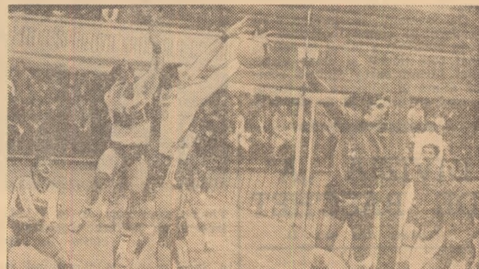
Un atac al steliștilor care străpunge blocajul jucătorilor vest-germani

20 și 22 februarie la Madrid (C.C.E.) și Bruxelles (Cupa cupelor).