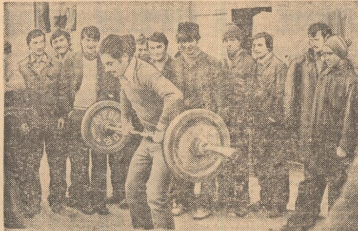
Tinerii muncitori de la I.C.M.C.C. își măsoară forțele într-o întrecere de haltere organizată la locul de muncă de către asociația lor sportivă, „Metalul”.

populara „Daciada” sportivi de la „Gloria” (asociația sportivă a Grupului de șantier nr. 4), care au ridicat frumoasele blocuri „Grădinița”, „Casata”, „Dunărea”. Vin, apoi, tinerii de la „Victoria”, asociația sportivă a Grupului de șantier nr. 3, băieții care au înălțat cartierele Pantelimon și Colentina, care au lucrat la pasajul Bucur-Odor. Vin, în frunte cu președintele acestei asociații, tehnicia-