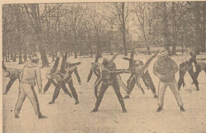
Universitatea Craiova executind o încălzire energetică, înainte de a intra în program.

gura, deși se repede să obțină autografele campionilor. Dacă s-ar fi pus următoarele întrebări, s-ar fi obținut următoarele răspunsuri: