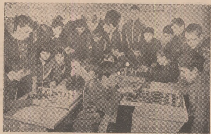
...și Școala generală nr. 117 (fără condiții)