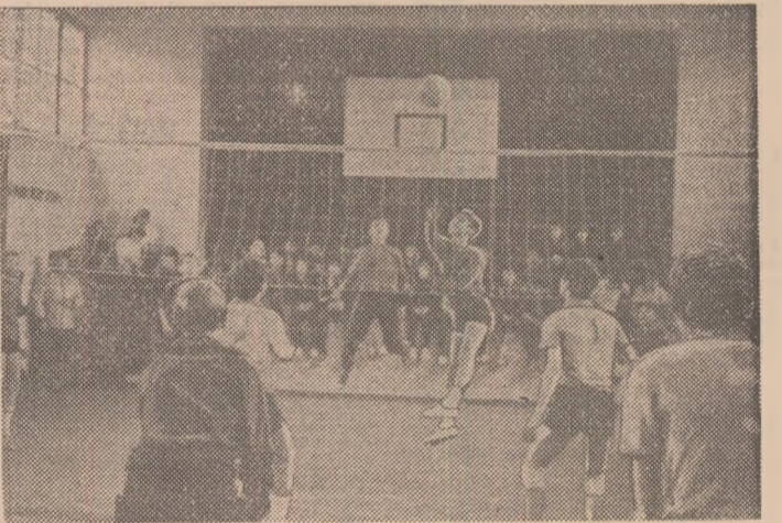
În sala Liceului T. Vladimirescu (cu condiții)

Ne oprim prima dată în fața Liceului „Tudor Vladimirescu”. Ora 9.30. Una din cele trei fe-