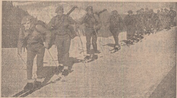
Omogenitatea, spiritul de echipă — factorii hotărâtori în obținerea rezultatelor bune

Duminică, la finale, au fost prezenți tovarășul Ion Coman, membru al Comitetului Politic Executiv, secretar al C.C. al P.C.R., general-maior Constantin Olteanu, ministrul apărării naționale, generali și ofițeri su-