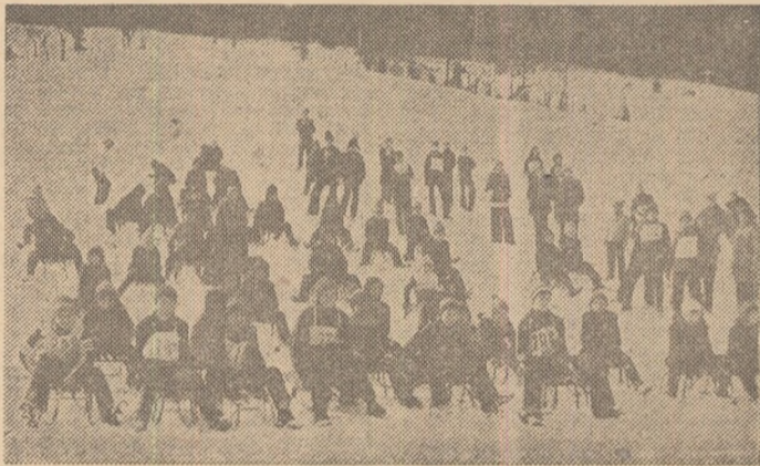
Imagine de la un concurs premergător finalelor „Daciadei“ organizat în Cîmpulung Moldovenesc.