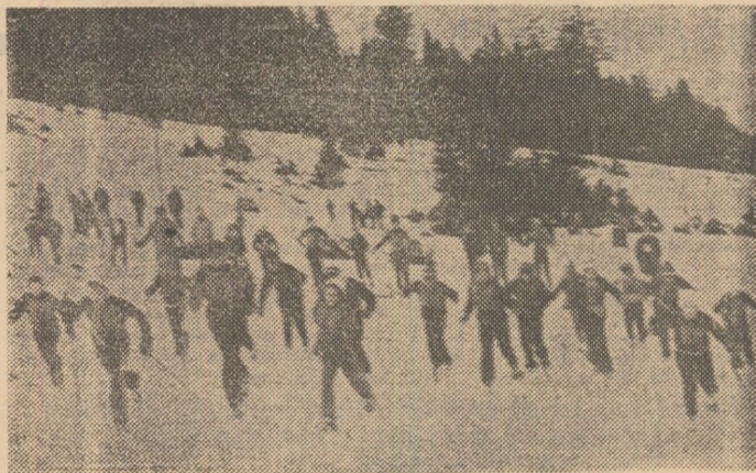
Schiul, așa cum au arătat întrecerile etapei a II-a a „Daciadei” de iarnă și-a cucerit pretutindeni noi adepți. În imagine, competiție pentru finalele de la Vatra Dornei (categ. 11-14 ani) desfășurată pe pîrțile de la Cîmpulung Moldovenesc...

La această etapă de bilanț, faptul cel mai demn de luat în seamă este acela că „Daciada”