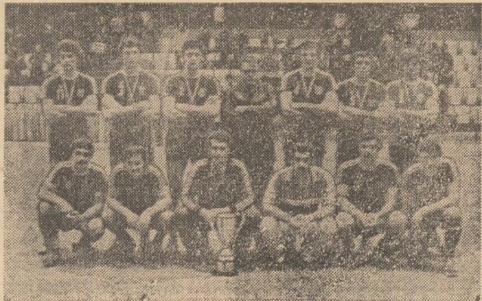
Formația Steaua, cîștigătoare a celei de a treia ediții a „Cupei României”