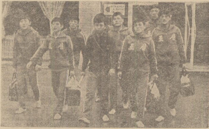
Reprezentativa de box a R.P.D. Coreene în drum spre sala de antrenament de la complexul sportiv „23 August”.

Așteptăm cu interes intrucerile din cadrul „Centurii de aur” și datorită prezenței numeroșilor oaspeți de pes-