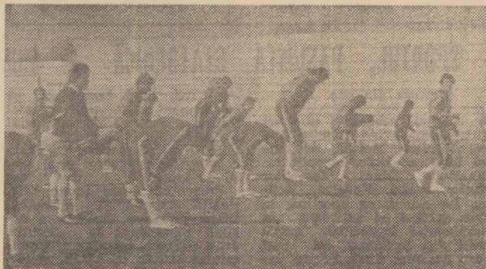
Aspect de la antrenamentul „tricolorilor” desfășurat ieri dimineață pe terenul I.C.S.I.M.

selecționabililor în fața unui adversar puternic, cum este considerată echipa Poloniei. Dealtfel, în dimineața jocului vom avea o discuție cu antrenorii și medicii echipelor care dau jucători la lot pentru a pune la punct, în amănunt, programul de instruire al perioadei imediat următoare, în ideea ca toți jucătorii să atingă forma sportivă maximă în timpul meciurilor cu Anglia și Ungaria”.