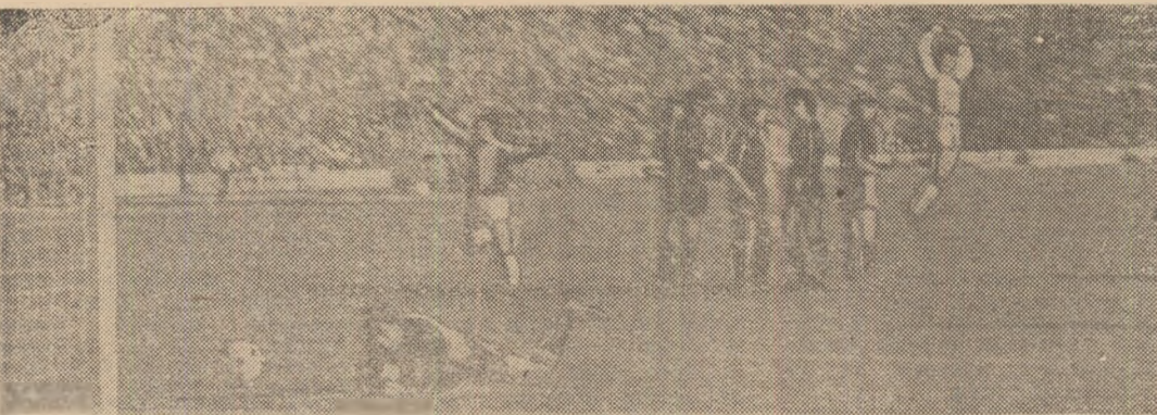
Păltinișan (care sare în sus de bucurie) a transformat excelent o lovitură liberă din preajma careului lui Iordache și acesta va trebui să scoată mingea din poartă: „Poli” Timișoara — Steaua 2-1.