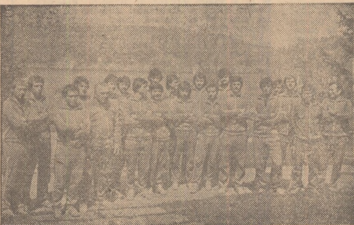
Fotografie de grup: lotul reprezentativ și antrenorii lui după terminarea ședinței de pregătire de ieri.