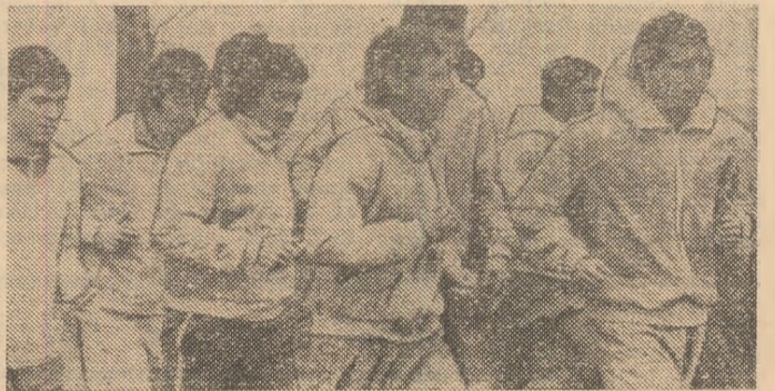
Înainte plecării, un ultim antrenament al tricolorilor

Înainte meciului cu Anglia, de la Londra, ne-am permis să facem o comparație. Era vorba de faptul că cele două echipe se aflau în fața unei stăchete înălțate la 2,25, accesibilă ambilor adversari, dar în care echipa română avea avantajul a trei încer-