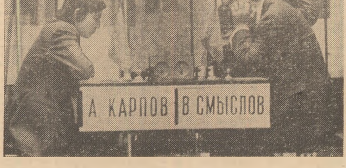
Asistînd la partida dintre campionul mondial Anatoli Karpov și fostul deținător al titlului, Vasili Smislov

propagandă „jocului minții”. Cam câte partide de concurs joci într-un an, Tolea? — După cum este cunoscut, am declarat imediat după cucerirea titlului de campion mondial că voi juca mult, că nu mă voi refugia niciodată într-un „turn de