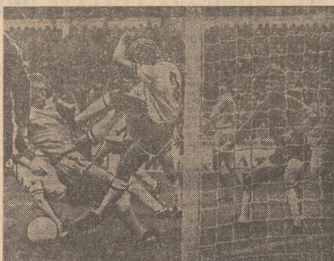
Pe „Wembley”, în finala „Cupei Angliei”, desfășurată sîmbătă, Tottenham Hotspur și Manchester City au terminat nedecis, după prelungiri: 1-1. De notat că ambele goluri au fost înscrise de același jucător, Hutchinson, de la Manchester. În imagine, o fază fierbinte la poarta lui Tottenham. Partida va fi rejucată mâine.

În concluzie, maniera contradictorie în care se stabilesc învîingătorii creează unele confuzii și dificultăți atît arbitrilor, cît mai cu seamă sportivilor și antrenorilor care sînt obligați să opereze modificări în metoda antrenamentului. Sperăm ca forumul continental să găsească soluțiile necesare pentru ca asemenea situații să nu se mai ivească.