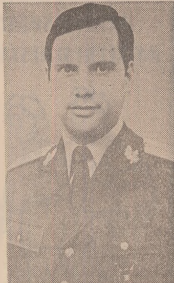
Cosmonautul cercetător român Lt. major DUMITRU PRUNARIU

Sistemele aflate la bordul navei lucrează normal. Cosmonauții Popov și Prunariu se simt bine.