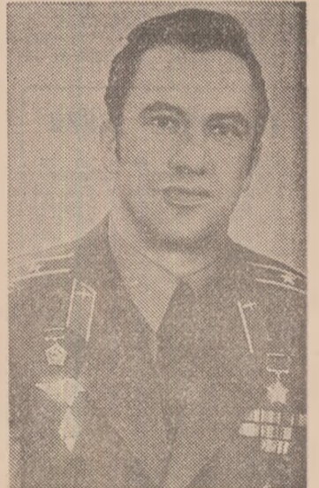
Pilotul cosmonaut sovietic LEONID POPOV

În pagina a IV-a: Relatări despre lansarea navei „Soiuz-40” de pe cosmodromul Baikonur