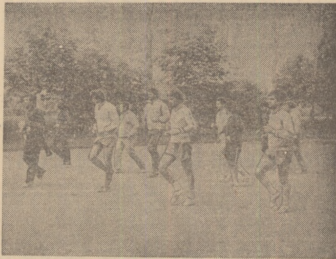
Selecționabilii, în timpul unui antrenament cu caracter fizic, efectuat, ieri, la Snagov.

sprinturi pe o pistă cocheta, care într-adevăr te îmbia la alergare, conduse, ca starter și animator, de antrenorul secund Victor Stănculescu, sub „ochii